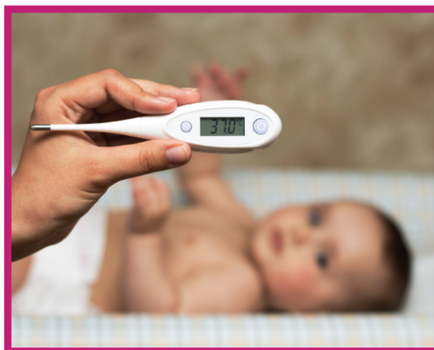
в прямой кишке (выше на 0.6–1.2°C)