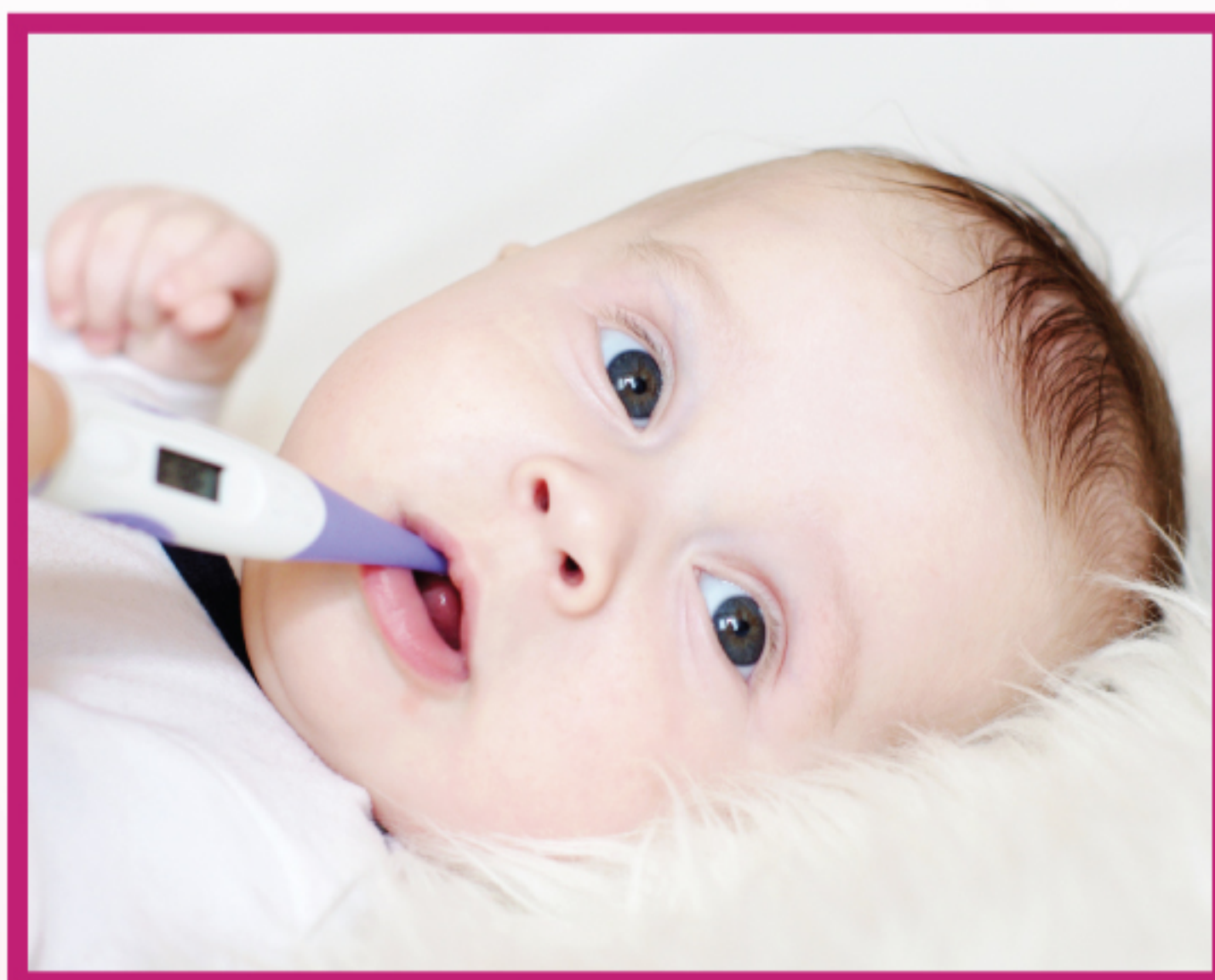
в ротовой полости (выше на 0.3–0.6°C)