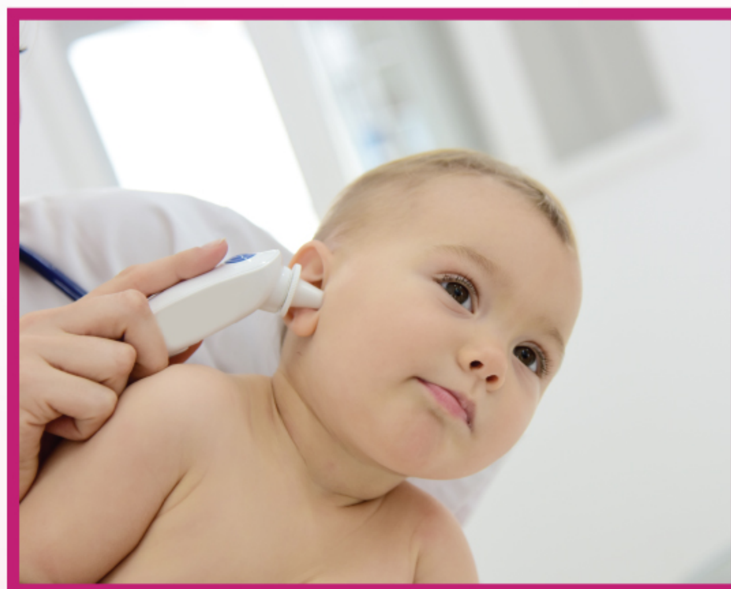
в наружном слуховом проходе (выше на 0.6–1.2°C)

УРОВНИ И ГРАНИЦЫ ПОВЫШЕННОЙ ТЕМПЕРАТУРЫ ПРИ ИЗМЕРЕНИИ В ПОДМЫШЕЧНОЙ ВПАДИНЕ: