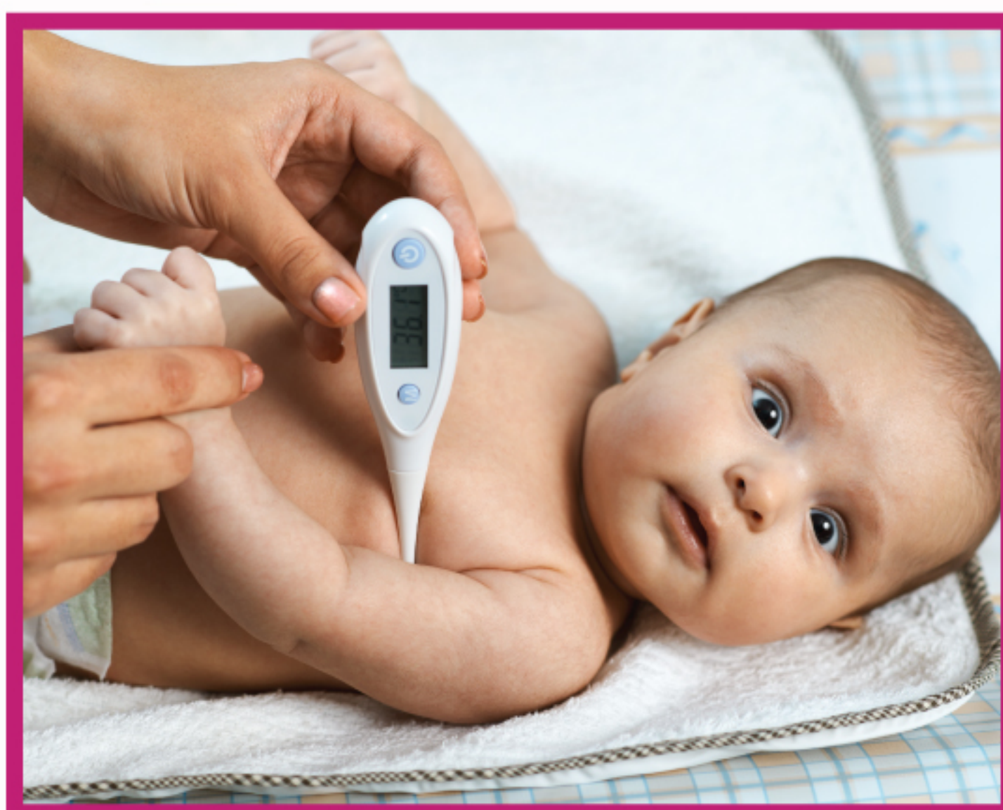
в подмышечной впадине

НАИБОЛЕЕ РАСПРОСТРАНЕННЫЕ СПОСОБЫ ИЗМЕРЕНИЯ ТЕМПЕРАТУРЫ У ДЕТЕЙ: